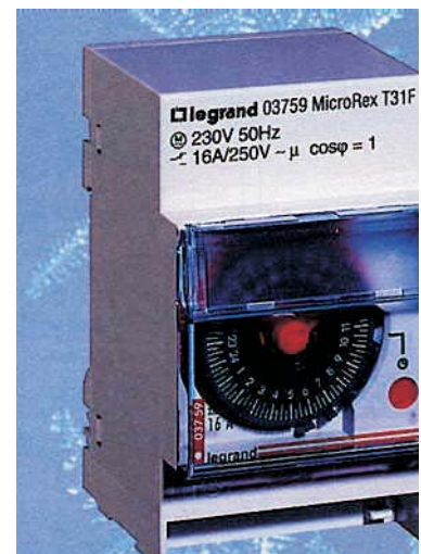
Hodiny odtávací Micro