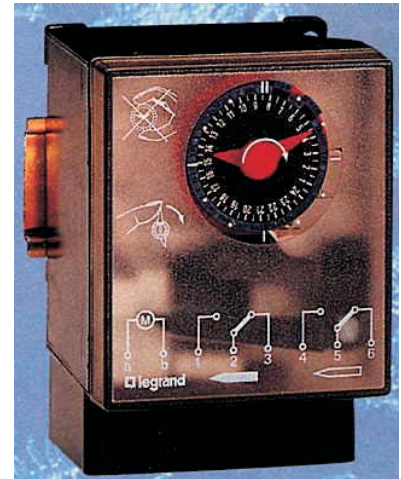
Hodiny odtávací Polar